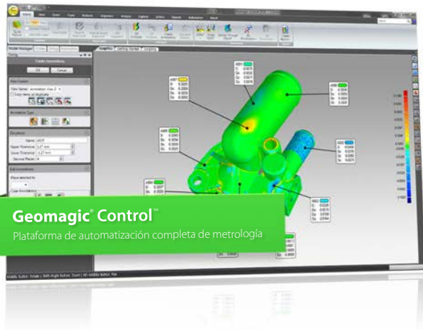
Geomagic® Control™ Plataforma de automatización completa de metrología

Lleve objetos físicos directamente a CAD, exprima su proceso de desarrollo de productos y automatice una inspección 3D de precisión con Geomagic Capture: el sistema de software y escáner 3D eficaz, integrado y de nivel industrial